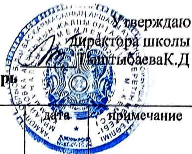
График посещения уроков на декабрь