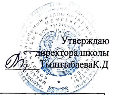
График посещения уроков на сентябрь